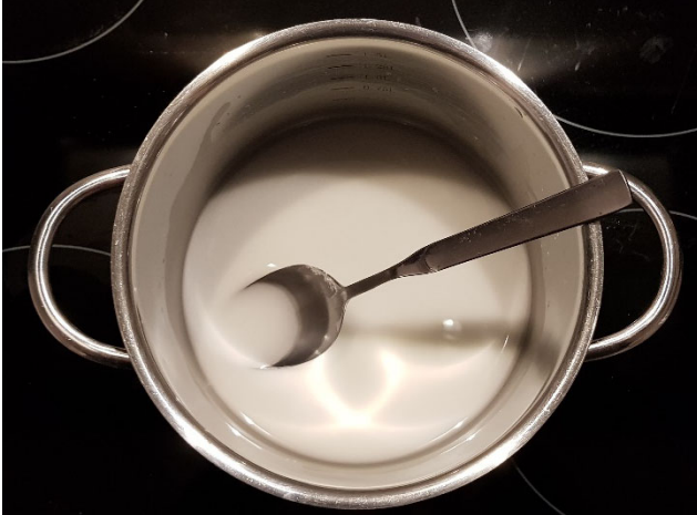
Abbildung 3: Speisestärke, Wasser und Glycerin Mischung vor dem Erhitzen.