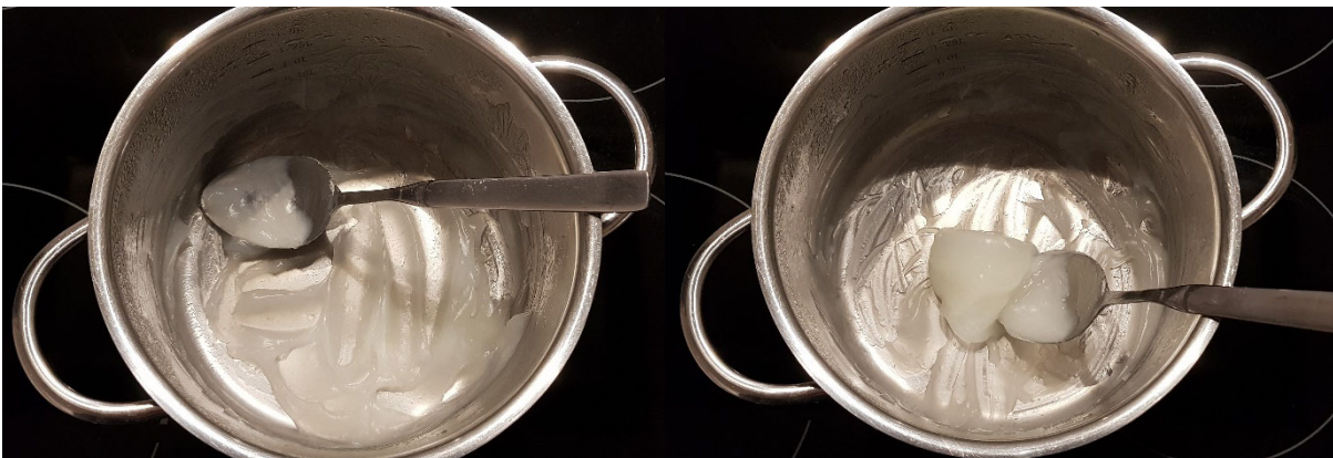
Abbildung 4: Flüssige Grundmasse des Kunststoffes nach ca. 25-30 Minuten Erhitzen. Die Masse sollte leicht durchscheinend sein, sodass der Topfboden zu erkennen ist (links). Die Masse sollte gelartig und formbar sein (rechts).