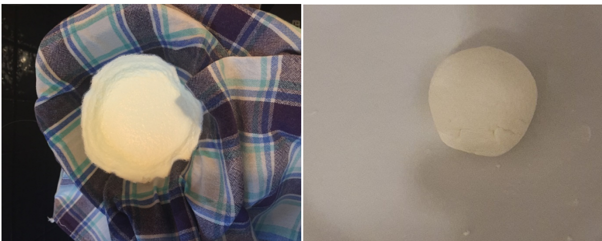
Abbildung 2: Trennen des Milch Kunststoffes von der Flüssigkeit im Sieb (links). Milch Kunststoff geformt zu einem „Reifen“ (rechts).

Um die Eigenschaften des Reifengummis zu optimieren, werden unter anderem Zusatzstoffe verschiedener Art in unterschiedlichen Mengen zugesetzt. So wird Autoreifen Ruß zugesetzt, der den Reifenabrieb verringert und dem Reifen die typische schwarze Farbe verleiht.